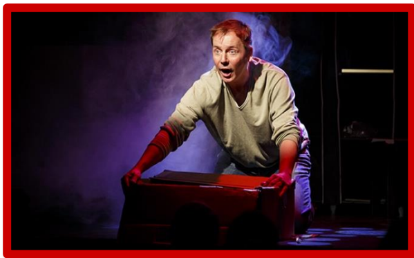
Aufs Bild klicken um Video (kleiner TEASER der Hamburger Show) zu starten

Dass wir mit PORNOSÜCHTIG ein Stück präsentieren, das die Leute zum Lachen bringt und zum Denken anregt und es wirklich schafft, Sexualität lustig und nicht peinlich umzusetzen, ist meiner Meinung nach ein Garant, dass das Stück noch in 5 Jahren sehr aktuell sein und gespielt werden wird.