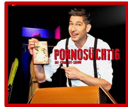
Aufs Bild klicken um Video (kleiner TEASER der Stuttgarter Show) zu starten